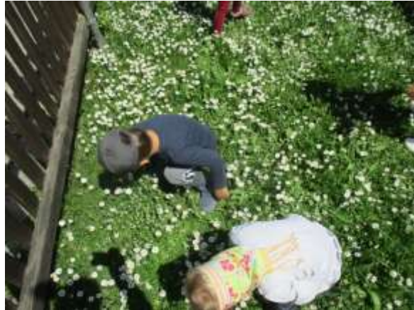
Bild vom Kind