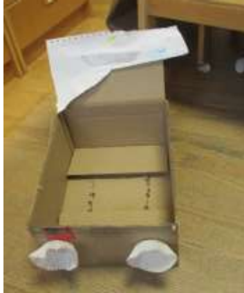
BMW SPORTKLASSE MIT SPOILER IST DAS ENDPRODUKT