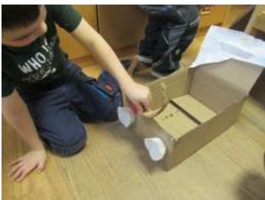
WIR BAUEN UNS EIN AUTO....EIN KLEINES

Auch Anregungen von außen (Eltern, Umfeld) können in das Projekt mit einfließen. Dadurch wird das Projekt in seiner Intensität und Lebenswirklichkeit bereichert.